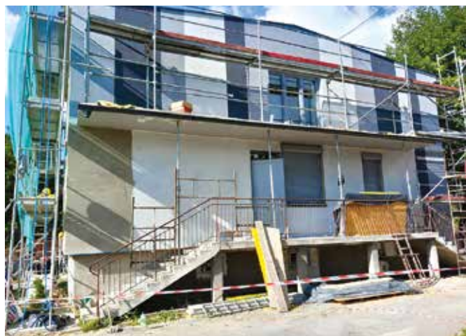
Roboty termomodernizacyjne w budynku w Zasolu obejmują m. in. docieplenie ścian zewnętrznych oraz wymianę stolarki drzwiowej i okiennej wraz z montażem rolet antywłamaniowych.

Postęp prac widoczny jest także w Zasolu, gdzie trwają roboty w budynku użyteczności publicznej Zespołu Szkolno-Przedszkolnego. W ramach termomodernizacji obiektu wymieniono już drzwi i okna wraz z montażem rolet antywłamaniowych, docieplono ściany zewnętrzne. Sukcesywnie odnawiane są kolejne pomieszczenia, w tym m. in. piwnice budynku oraz sale lekcyjne (malowanie). Trwają prace instalacyjne w zakresie wentylacji mechanicznej. Zaawansowanie prac sięga już blisko 40%.