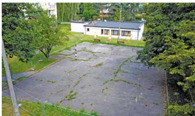
Boisko przed remontem.

W ramach inwestycji z boiska została usunięta stara nawierzchnia asfaltobetonu wraz z podbudową, a następnie wykonano nową nawierzchnię poliuretanową. Na powierzchni boiska wyrysowano gry podwórkowe – chińczyk, klasy potrójne, kalkulator, rakietę/planety/galaktyka, labirynt, guziki,