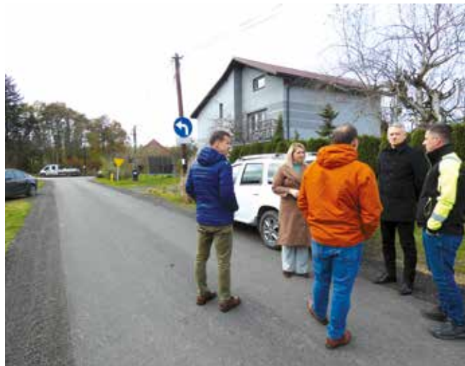
Ul. Grzybowa – odbiór prac remontowych.

Zadanie zostało w całości wykonane i sfinansowane przez firmę PORR S.A.