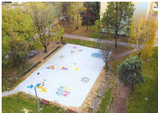
Boisko po remoncie.