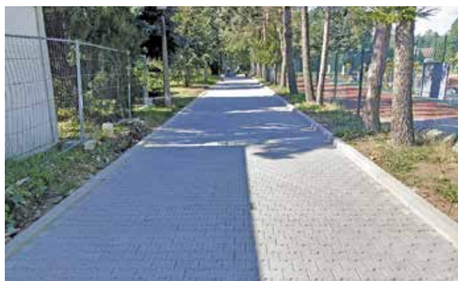
Przy obiekcie przebudowano drogę pożarową, umożliwiającą sprawny dojazd m. in. służbom ratowniczym.

Całkowita wartość obu kontraktów wynosi 14.245.000,00 złotych, z czego Gmina otrzymała 10.676.000,00 zł dotacji w ramach drugiej edycji rządowego Programu Inwestycji Strategicznych „Polski Ład”.