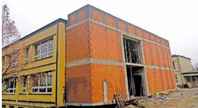
W rozbudowanym skrzydle Szkoły Podstawowej nr 2 powstaną dodatkowe sale lekcyjne oraz wybudowana będzie winda, która zapewni dostępność architektoniczną budynku.

Postęp prac widoczny jest także w Zasolu, gdzie trwają roboty w budynku użyteczności publicznej Zespołu Szkolno-Przedszkolnego. W ramach termomodernizacji obiektu wymieniono już drzwi i okna wraz z montażem rolet antywłamaniowych, docieplono ściany zewnętrzne. Sukcesywnie odnawiane są kolejne pomieszczenia, w tym m. in. piwnice budynku oraz sale lekcyjne (malowanie). Trwają prace instalacyjne w zakresie wentylacji mechanicznej. Zaawansowanie prac sięga już blisko 40%.