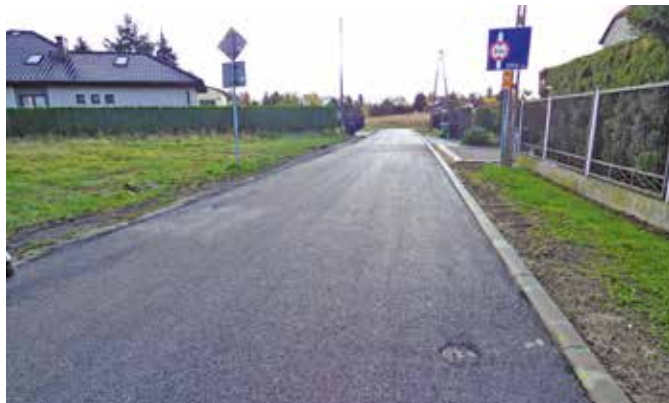
Ul. Kusocińskiego po remoncie.

Firma PORR S.A. zakończyła roboty w ramach zadania „Prace na linii kolejowej nr 93 na odcinku Trzebinia – Oświęcim – Czechowice-Dziedzice” polegające na przebudowie wiaduktów i przejazdów kolejowych. Firma PORR S.A. zawarła z Gminą Brzeszcze umowę, na mocy której samochody ciężarowe o masie powyżej 40 ton obsługujące inwestycję mogły poruszać się drogami na co dzień wyłączonymi z ruchu dla tego typu pojazdów. Burmistrz zastrzegł w umowie, że po zakończeniu prac PORR S.A. zobowiązany będzie do remontu dróg uszkodzonych w efekcie niestandardowego użytkowania.